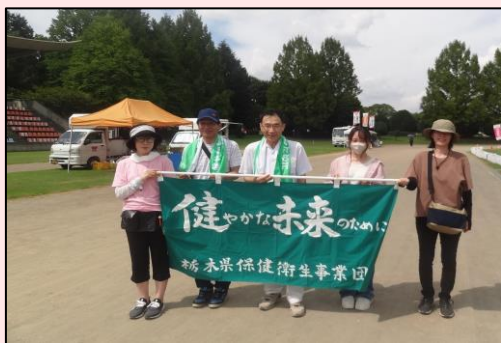
リレー・フォー・ライフ 2023 とちぎ 壬生総合運動公園 9月2日～3日