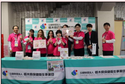
「とちぎ de ピンクリボン」イベント プレックスアリーナ 11月4日～5日