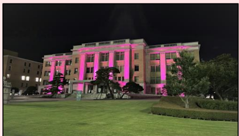
栃木県庁 昭和館 ライトアップ 9月16日～10月15日