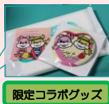
限定コラボグッス