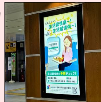
JR 宇都宮駅 看板設置