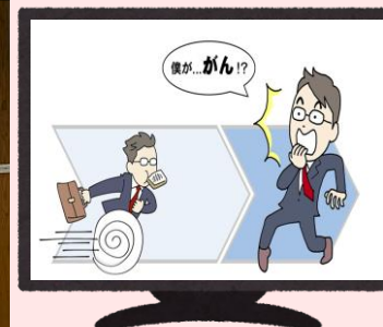
45秒CM放送 (とちぎテレビ)