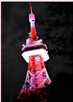
宇都宮タワーライトアップ 八幡山公園 9月1日～10日