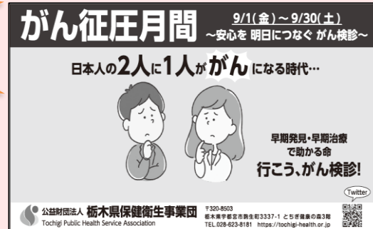
がん征圧月間 新聞掲載