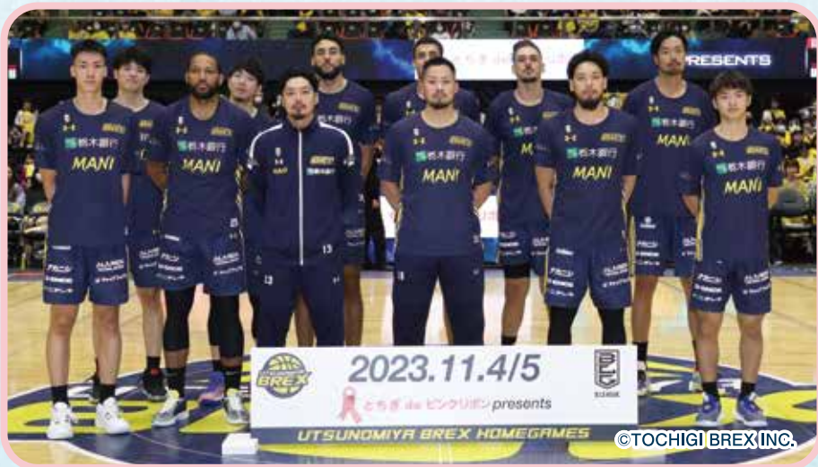
「とちぎ de ピンクリボン」イベント @ブレックスアリーナ(11月4日・11月5日)