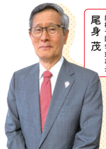
公益財団法人 結核予防会 理事長 尾身 茂

2023年3月の世界結核デーのテーマは「YES! We Can End TB(イエス! ウィ・キャン 結核終息)」でした。結核は人から人にうつる感染症です。結核ゼロを目指して、結核予防会は今後も結核制圧の手を緩めることなく、国内外の活動の強化に努めてまいります。複十字シール募金への皆さまのご支援ご協力をお願い申し上げます。