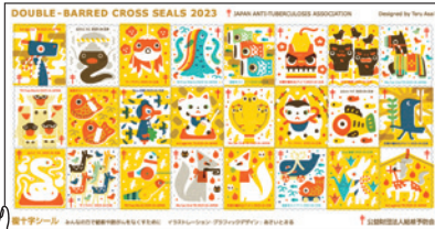
2023年度の複十字シール

“結核のない世界を実現すること”これは人類共通の願いです。病気の複十字シール運動への正しい理解とあなたの募金活動が、その夢を大きく引き寄せます。