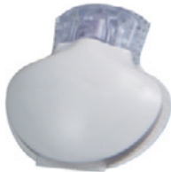
ミニメド620G/640Gトランスミッタ ガーディアンコネク iPro2 日本メドトロニック(株)