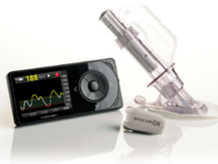
Dexcom G4 PLUTINUMシステム テルモ(株)