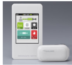
メディセーフウィズ テルモ(株)