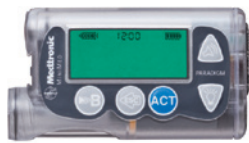
パラダイムインスリンポンプ 712/722 日本メドトロニック(株)