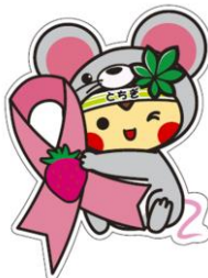
とちまるくん ©栃木県