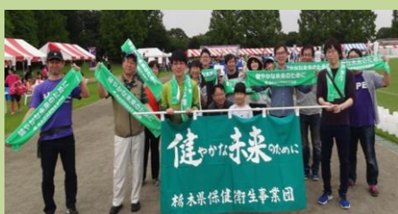
リレー・フォー・ライフとちぎ 参加・出展等