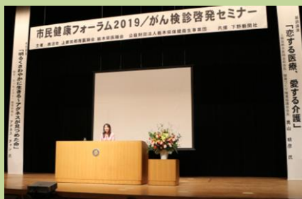
市町との共同開催 特別講演会 (がん検診啓発セミナー)