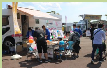
検診車・パネルの展示 (働くクルマ大集合!!)