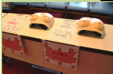
乳房自己触診体験を設置 (がん検診啓発セミナー)