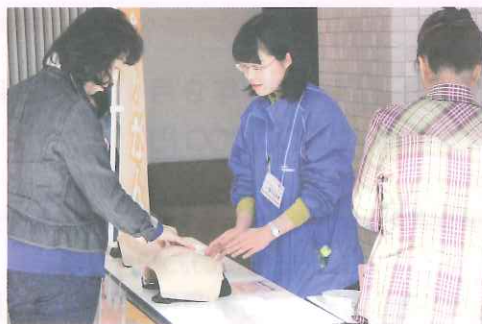
保健師による乳房自己触診体験 （がん検診啓発セミナー2016 真岡市民会館）