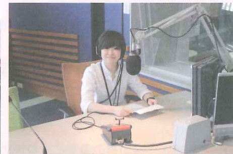
がん検診を行っている 技師や看護師による ラジオでの検診啓発告知