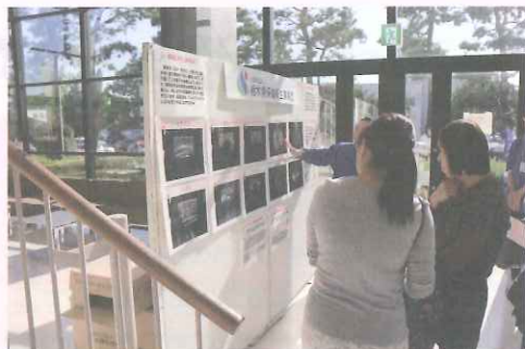
放射線技師・検査技師による 検査画像の説明